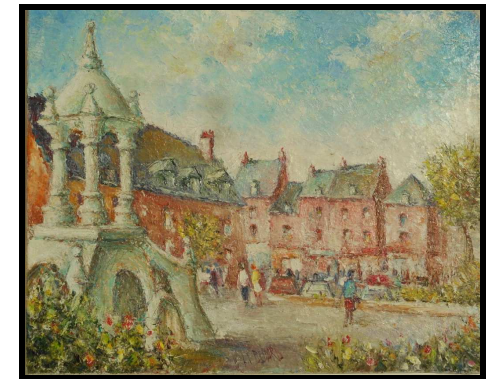
Peinture de Michel BENARD - Saint-Saëns